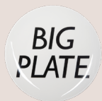
28.5cm 平盘 (特大) (黑色)

D110-01B 28.5 x 28.5 x 2.5 cm 11.2 x 11.2 x 1 Inch