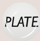
25cm 平盘 (大) (黑色)

D110-01B 28.5 x 28.5 x 2.5 cm 11.2 x 11.2 x 1 Inch