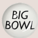
23cm 汤盘 (黑色)

D110-04B 15 x 15 x 1.5 cm 5.9 x 5.9 x 0.6 Inch